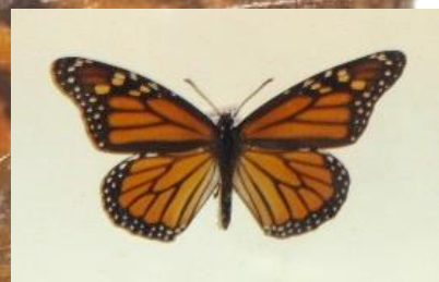
Figura 4. Adulto depositado en la Colección de insectos de del Smithsonian Museum of Natural History, Washington, D.C., Estados Unidos.

Se conocen aproximadamente 155,000 especies de lepidópteros en el mundo, de las cuales 14,500 están presentes en México (Llorente et al. , 2014) y 1,103 especies diurnas se enlistan en el estado de Oaxaca (Martínez et al. , 2004).