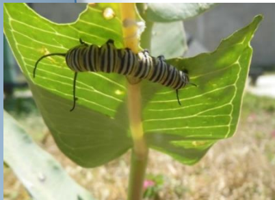
Figura 2. Larva de quinto instar alimentándose de A. syriaca , misma localidad.