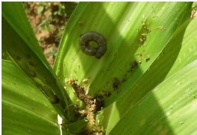
Figura. 10. Gusano cogollero Spodoptera frugiperda (Smith) alimentándose de la planta del maíz en Cuilapam de Guerrero, Oaxaca.

los estados de México, Hidalgo, Puebla, Tlaxcala, Querétaro, San Luis Potosí, Jalisco, Oaxaca, Chiapas y el Distrito Federal (Granados, 1993; Ramos-Elorduy, 2006; Llanderal-Cázares et al. , 2010), los cuales se venden en los mercados del estado de Oaxaca y se utilizan también en la industria del mezcal, sobre todo en el estado de Oaxaca.