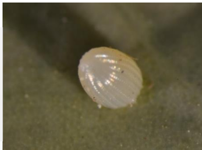
Figura 1. Huevecillo, tomado sobre Asclepias syriaca L., en el CIIDIR Oaxaca, Santa Cruz Xoxocotlán, Oaxaca.